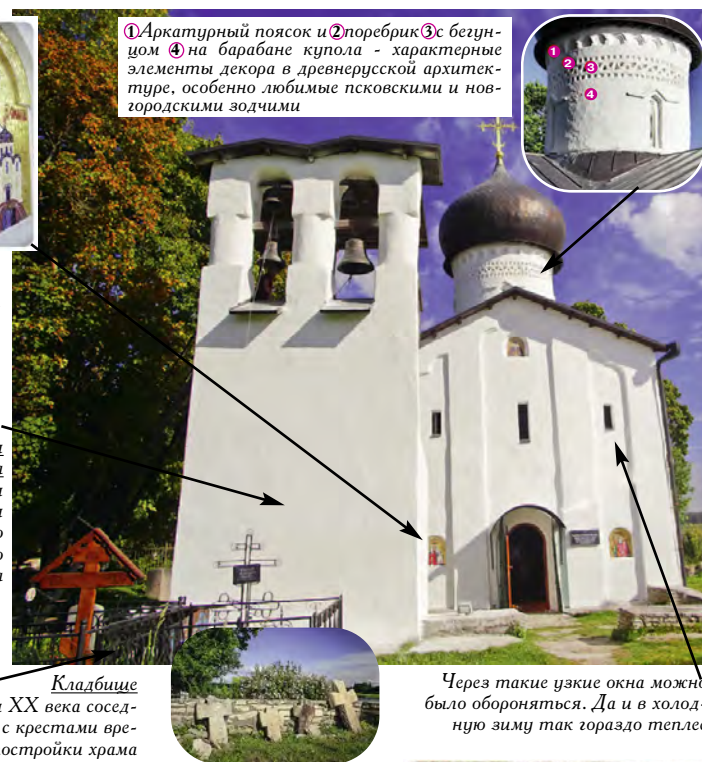
Кладбище Захоронения XX века соседствуют здесь с крестами времен постройки храма