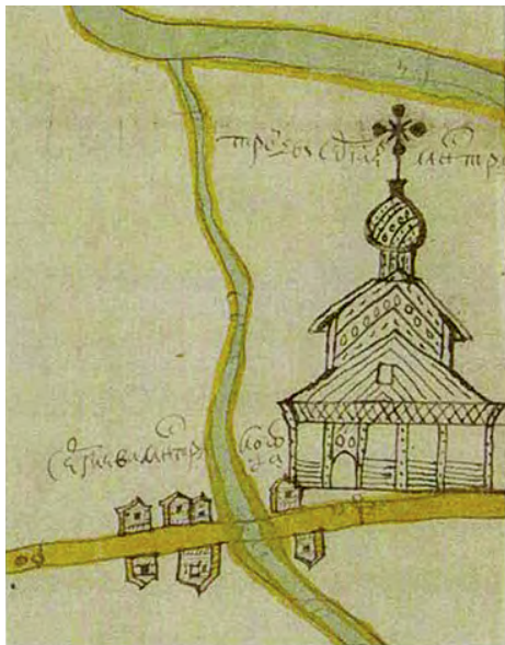
Церковь на плане земель Великолуцкого Троице-Сергиева монастыря 1699 г.

В середине XIX века И.М. Пульхеров отмечал уникальность этого храма благодаря небольшому ковчегу с 20 частицами от святых мощей: преподобного Сергия Радонежского, великомуч. Димитрия, Иакова Персианина, Феодосия Печерского, Ионы и Алексия, митрополитов Московских, преподобного Нила Столобенского, Герасима, Леонтия, папы Римского, муч. Иустины, великомуч. Аникиты, Михея ученика преподобного Сергия, Иллариона Иконийского, Мины, Мартирия, Иакова Боровичского, Киприана, Фомы, Потапия Римлянина. Также в нем хранились части древа Животворящего Креста Господня, камня и пелены Антония Римлянина. Эти святости появились в монастыре в 1715 году благодаря митрополиту Новгородскому и Великолуцкому Иову. В начале XIX века их собирались перенести из монастыря в Троицкий собор на центральной площади Великих Лук, но благодаря игумenu Иосифу они остались на месте «... для отвращения в верующих соблазна или, чего Боже храни, и самого возмущения». Также с этого времени в монастыре устанавливается традиция крестного хода на 5 (18) июля — день обретения мощей преподобного Сергия Радонежского.