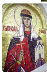
Одна из трех мозаичных икон западной стены Ильинского

Один из огромных камней времен ледникового периода недалеко от Ильинского храма. По преданию, на нем сохранился отпечаток стопы княгини Ольги. Подобные камни - не редкость в этих краях. В 1930-е храм Ильи Пророка в Выбутах закрыли, церковь святой Ольги (1914) разрушили. А камень-следовик взорвали. Сейчас на его месте установлен памятный знак в виде пирамиды из валунов, увенчанный крестом.