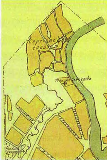
Сергиевская Слобода и монастырь на карте Великих Лук 1909 г.

(Продолжение. Начало в № 12 за декабрь 2020 года)