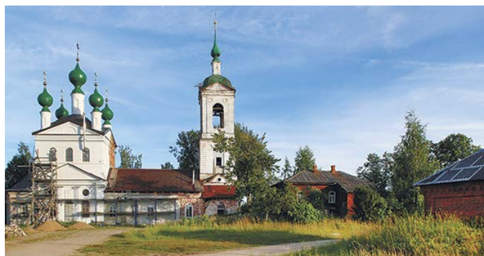
Храм Преображения Господня в селе Спас-Подгорье