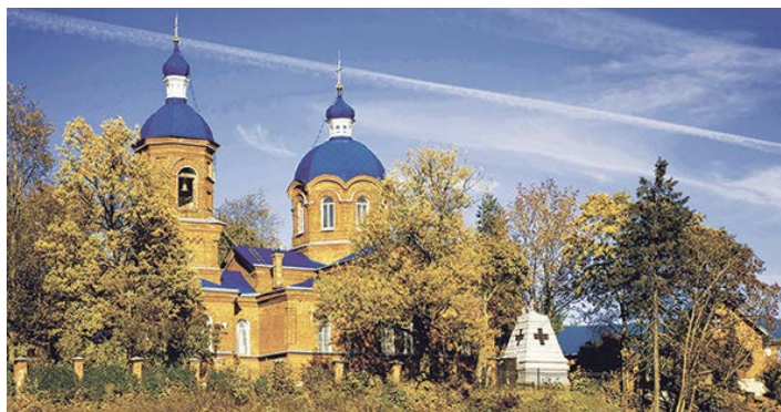
Храм Рождества Пресвятой Богородицы в селе Рождествово Ярославской области