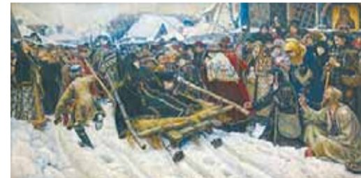
БОЯРЫНЯ МОРОЗОВА (Перед картиной В. Сурикова)

Разгулялся пустынный плес, Бьет Великая Зло и вольно! Безъязыкие колокольни, Словно витязи — против гроз!