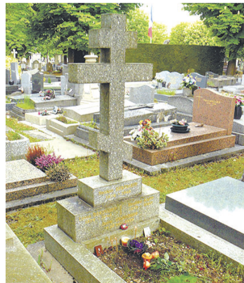
Могила Н.А. Бердяева. Кладбище Буа-Тардьё, коммуна Кламар, департамент О-де-Сен