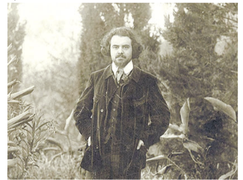
Николай Бердяев, 1912 год

На эту перемену повлияла и общая атмосфера Серебряного века, наполненная увлечением всем таинственным, лежащим за границей человеческого разума. Николай часто бывает в салоне символиста Вячеслава Иванова, который зовут «башней». Там собирается весь цвет столичной интеллигенции – писатели, поэты, художники и философы: Александр Блок, Анна Ахматова, Валерий Брюсов, Константин Бальмонт, Максимилиан Волошин, Федор Сологуб, Константин Сомов, Лев Бакст, Василий Розанов. В салоне много говорят о вере и о том, как она изменит мир. Впрочем, сопровождается все это самым упадочническим декадентством: попытки имитировать языческие мистерии. Позднее Бердяев вспоминал об этих годах в столице с нескрываемым отращиванием.