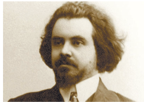
Русский религиозный философ Николай Бердяев

Уже в 1920 году Бердяева в первый раз арестовали по делу о «Тактическом центре», подпольной антибольшевистской организации. Но к ней он был совершенно непричастен, и ученого пришлось отпустить. В 1922 году Ленин заявил, что больше не будет терпеть в СССР контрреволюционную интеллигенцию, и потребовал выслать из страны несколько сотен ученых, чье мнение о советской власти было недостаточно восторженным. Бердяева арестовали вновь и объяснили, что или он уезжает, или будет расстрелян. Философ выбрал изгнание. В сентябре 1922 года на «Философском пароходе» он покинул Россию навсегда, вместе с ним отравились более двухсот человек, чьи имена составляли гордость отечественной науки.