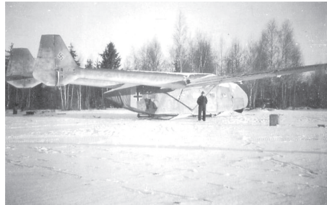
Военно-транспортный планер Go.242, такие планеры немцы использовали для снабжения гарнизона города Великие Луки

рый вследствие многочисленности окруженной группировки и удаленности от основных частей групп армий «Б» и «Дон» нельзя было в полной мере снабжать по воздуху с должной эффективностью, то «крепость Великие Луки» отделяли от внешнего фронта окружения лишь десятки километров, а численность гарнизона была небольшой. Для снабжения гарнизона немцы применяли военно-транспортные планеры Go.242, буксируемые бомбардировщиками «Хейнкель-111» до района котла, где они отцеплялись и садились на подконтрольной территории. При помощи транспортных планеров немцы доставляли