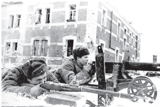
Советские пулеметчики в бою на улице Энгельса в Великих Луках

Одним из наиболее крепких очагов обороны в городе была Великолукская крепость, ее неуязвимость заключалась в шестнадцатиметровом валу. У подошвы вала его толщина достигала 35 метров. По верхней части вала проходили траншеи. Перед ними — остатки другого крепостного вала, задутые снегом. За основным валом располагались контрэскарпы, оборудованные по всем правилам инженерной науки, противотанковые рвы. За ними немцы установили проволоочные заграждения, оборудовали подвалы-дзоты. В опорные пункты ими были превращены и имеющиеся постройки: церковь, тюрьма и две казармы. К северо-западу крепость имела с вала три водосточные трубы, а также проход — остатки бывшего ворот. Все подступы к Великолукской крепости находились под фланговым пулеметным огнем, немцы установили пулеметы на угловых выступах. С внешней стороны крепостной вал имел обледенелые скаты, которые каждую ночь поливались водой. Брать крепость предстояло бойцам и командирам 357-й стрелковой дивизии, которая принимала участие в Великолукской наступательной операции советских войск с самого первого его дня.