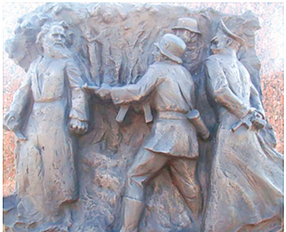
Барельеф с изображением подвига М. Кузьмина на стеле «Великие Луки — Город воинской славы»

В ноябре 1966 г. в Великолукский горком КПСС из города Данилов Ярослав-