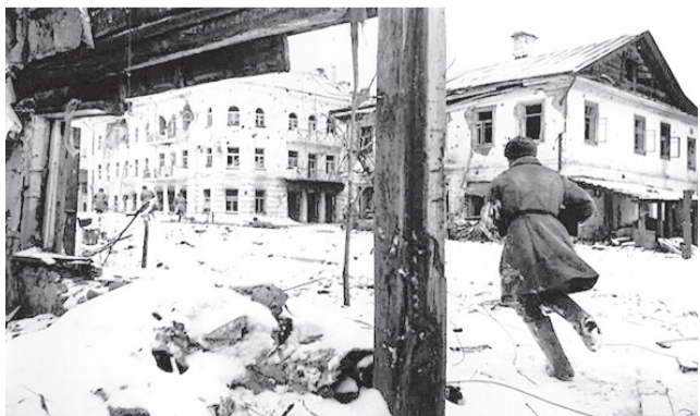
Советские солдаты в бою на улице К. Либкнехта (перекресток К. Либкнехта и ул. Пионерской) в Великих Луках

Немецкий историк Пауль Карель назвал происходящие в Великих Луках события «Сталинградом в миниатюре». В частности он писал: «Советские стрелковые батальоны сражались в городе с поразительной отвагой.