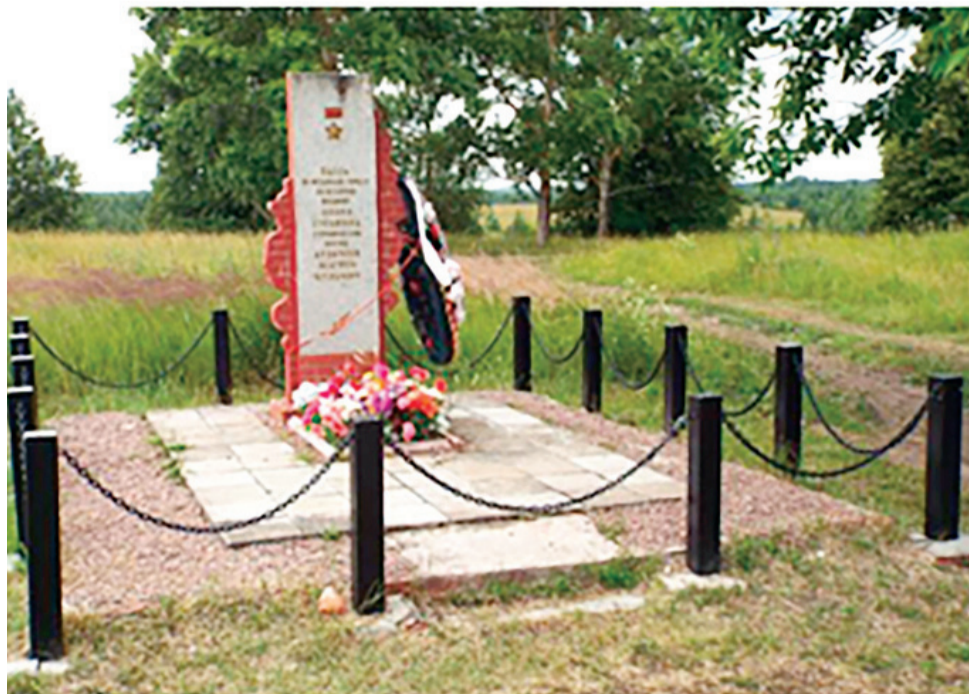
Обновленный обелиск на Малкинской высоте

По материалам «Великолукского вестника» (Краеведческий альманах № 11)