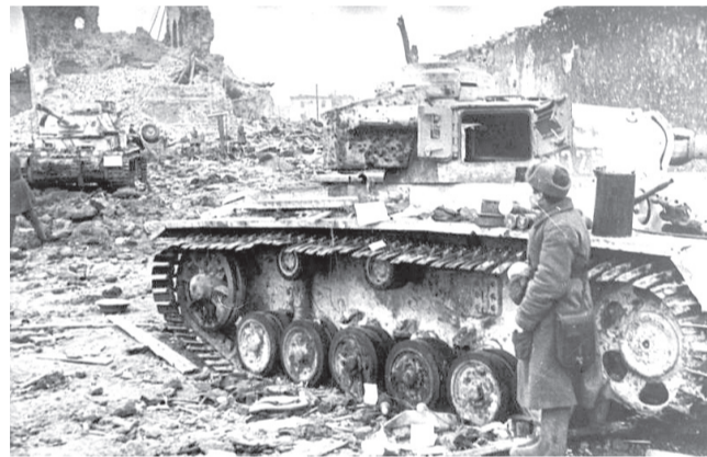
Советские солдаты осматривают немецкие танки, брошенные в Великих Луках