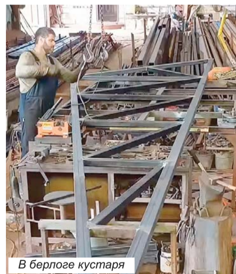
В берлоге кустаря