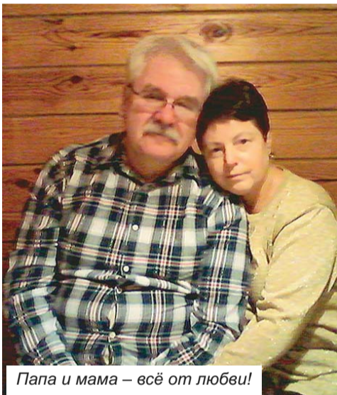
Папа и мама – всё от любви!