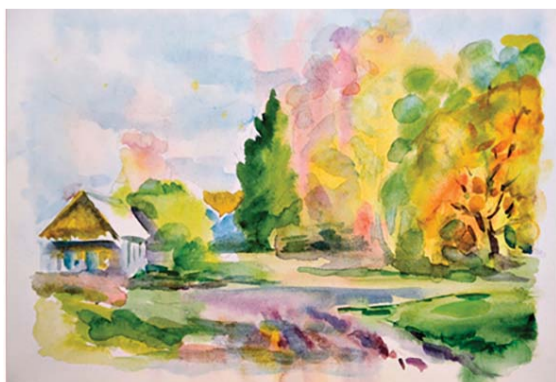
«Домик на опушке»

Времена, героев и события Запечатлевают по наитию Подвиги твоих сынов, Отчизна! – Русской речью Родина едина. Дорожите словом. Слово свято.