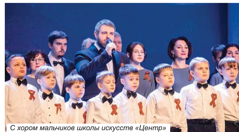
С хором мальчиков школы искусств «Центр»