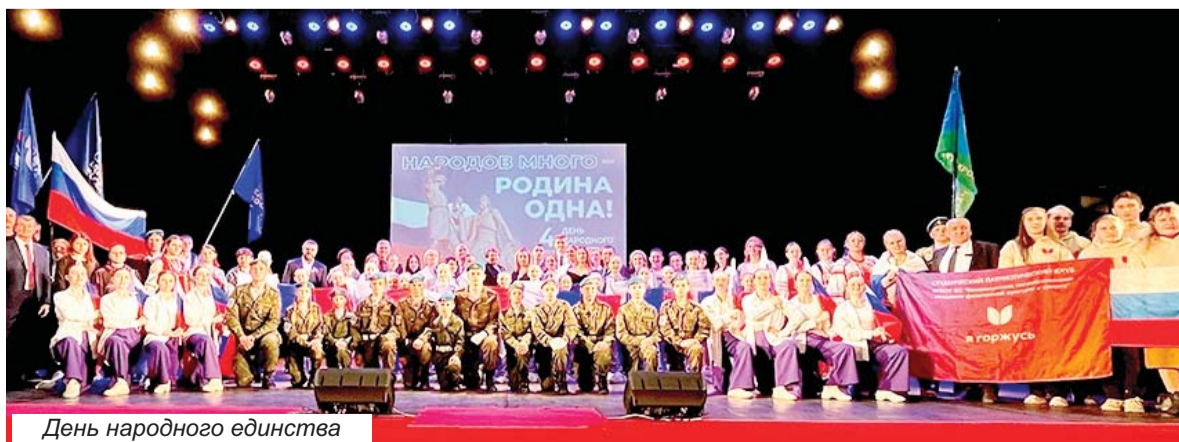
День народного единства